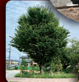
The zelkova, almost like a sacred tree, carries a commanding presence even in winter.