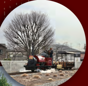
御神木のような存在の櫛は、冬でも存在感があります。